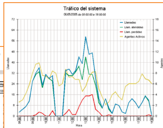
Permite adecuar el número de agentes al tráfico real

Configuración de Colas: Horarios, tratamiento de llamadas, umbrales, llamadas a atender, criterios de distribución a agentes, mensajes utilizados, URL asociadas, permisos de grabación, posibilidad de escape a buzón.